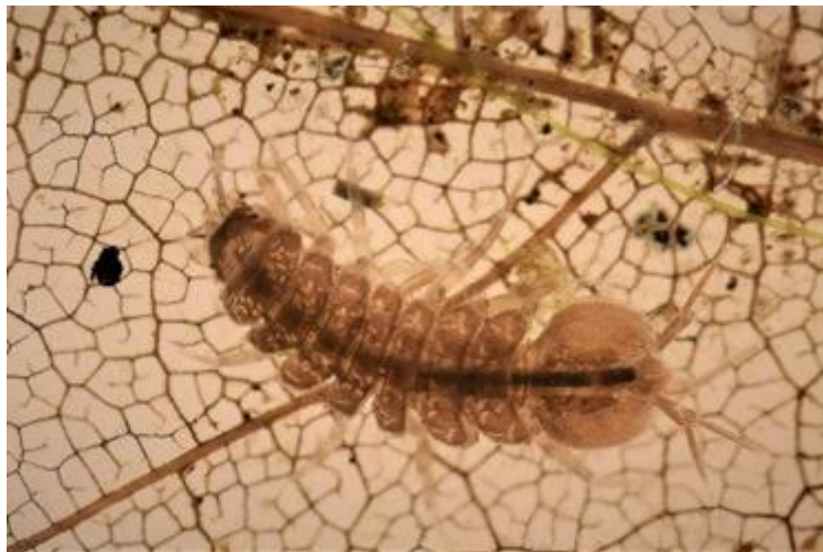
Zoetwaterpissebed ( Systema naturae )

Deze activiteit maakt deel uit van Expeditie Stadsnatuur 2026 , die loopt van 1 mei tot en met 30 juni . De eerder georganiseerde zondagmiddagexpeditie werd enthousiast ontvangen. Door de flinke regenbuien hebben we ons toen moeten beperken tot waterinsecten. Komende zondag 31-5 hopen we op beter weer, zodat we weer volop op ontdekkingstocht kunnen.